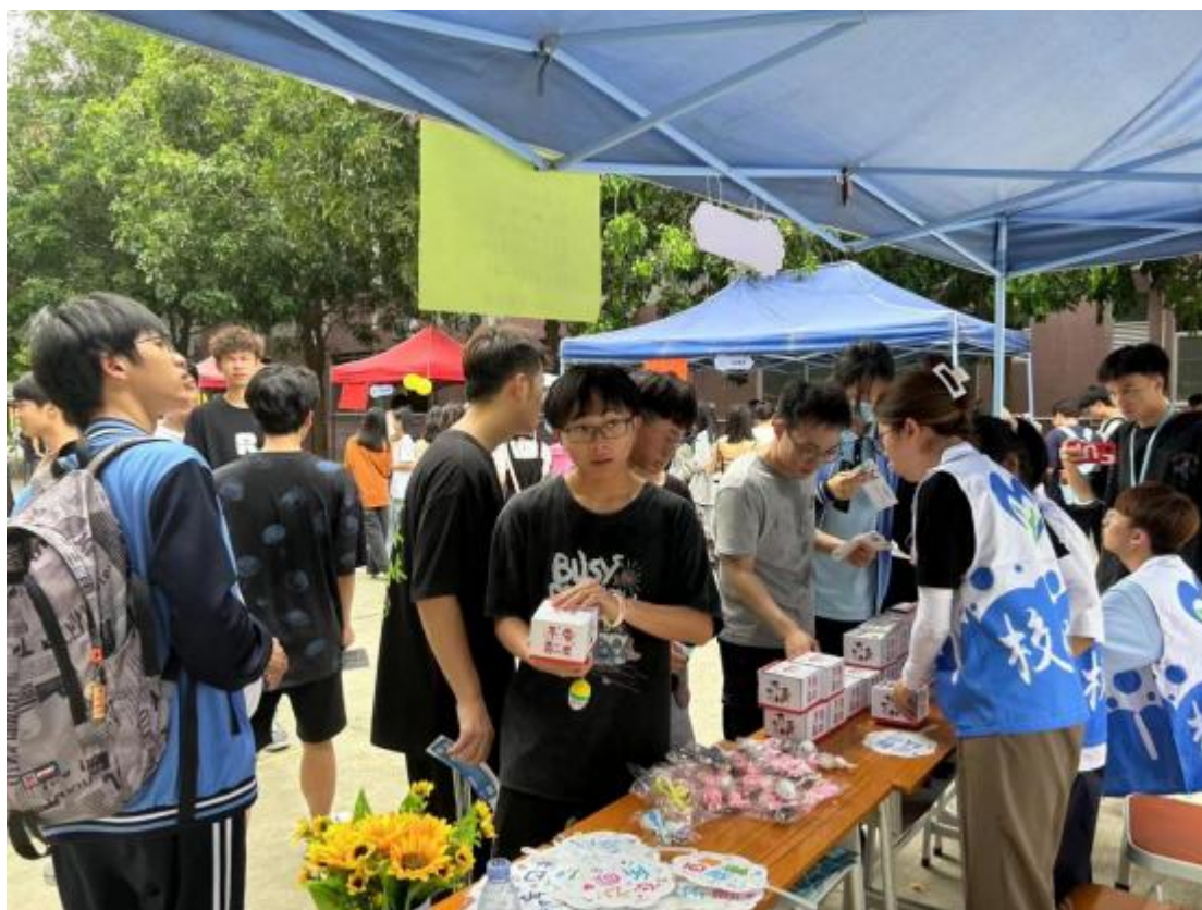
图 6 社团文化节