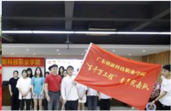
学校董事长亲临青年突击队出征现场