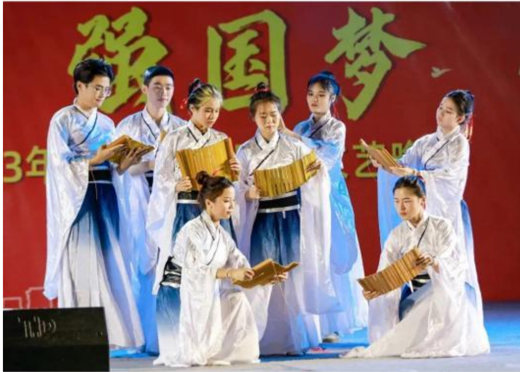
图 2 校园艺术展演