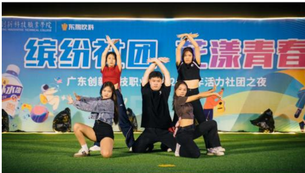
图 3 “社团之夜”晚会