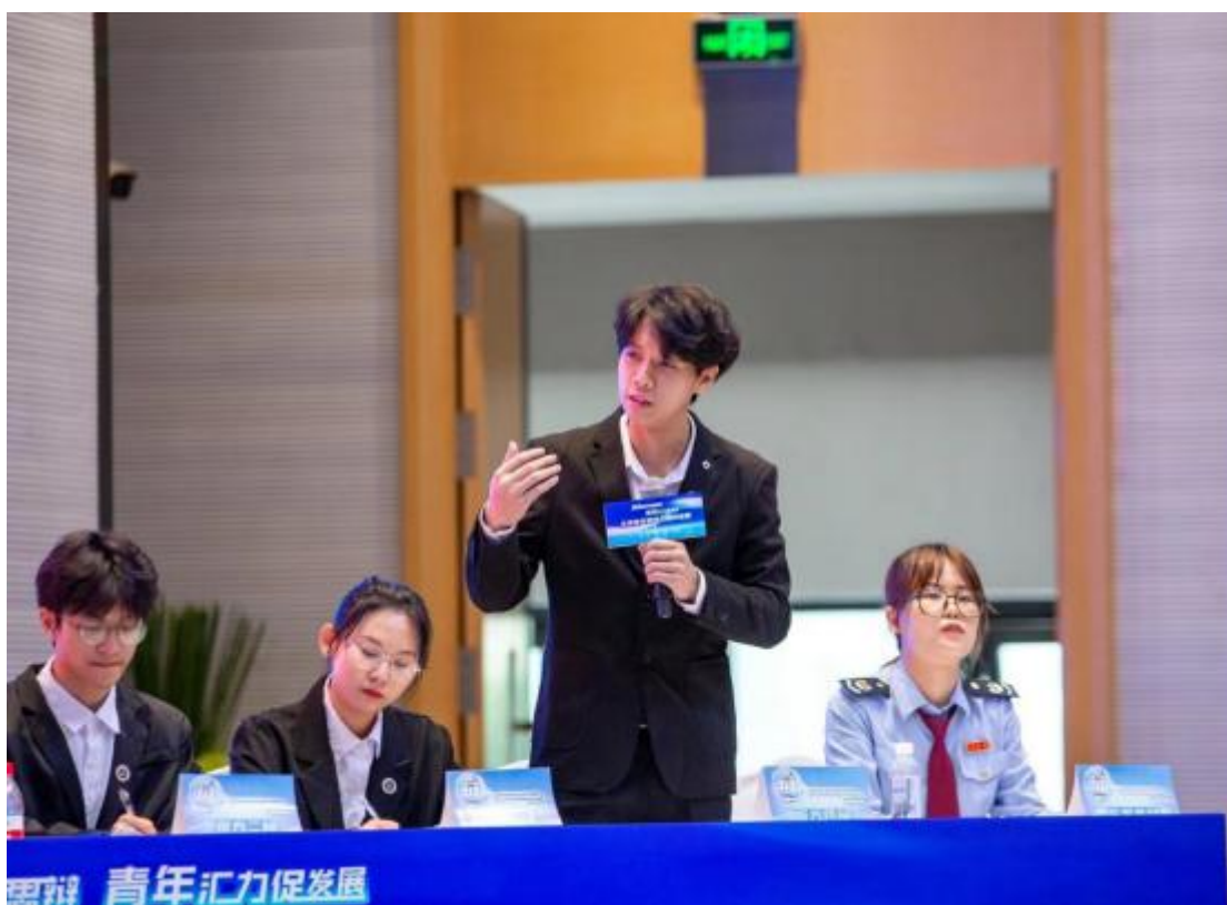
图 7 校园辩论赛