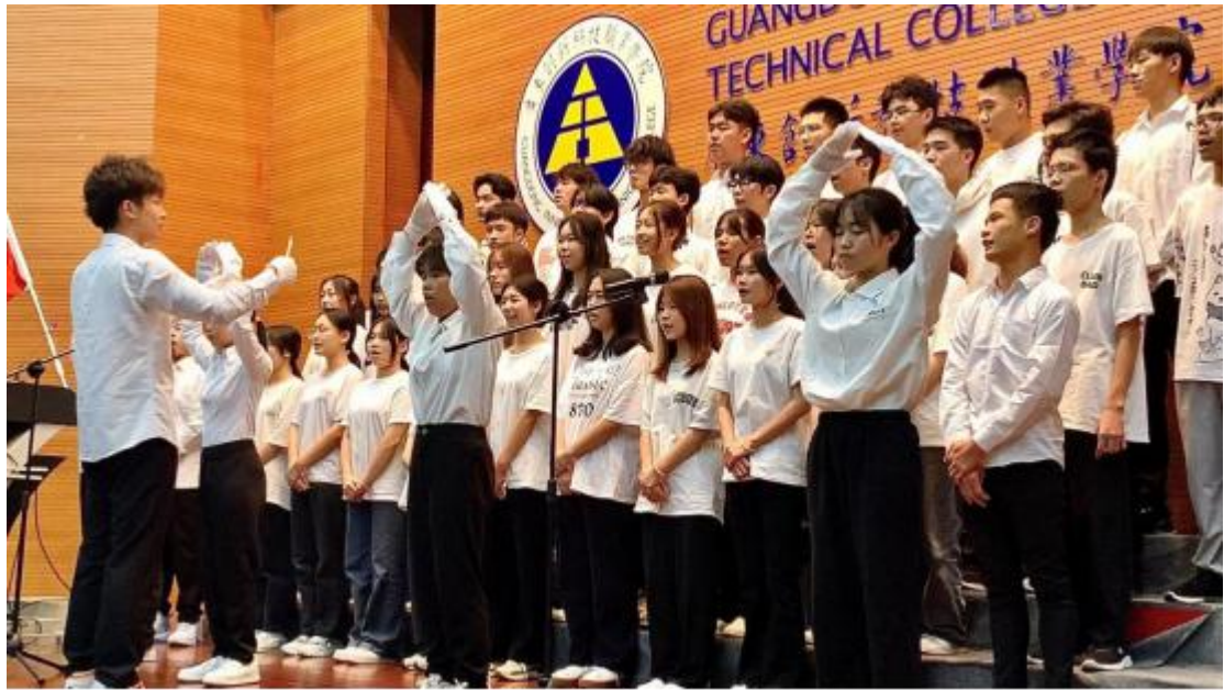
图 8 校园合唱比赛