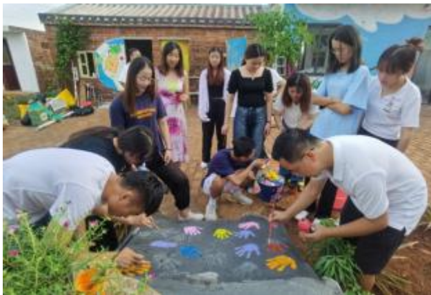
创新乡村振兴帮帮团师生共绘主题绘画