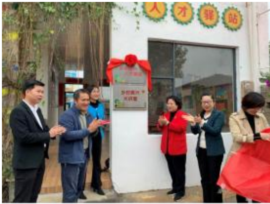
人才驿站揭牌，徐闻县委书记罗红霞出席