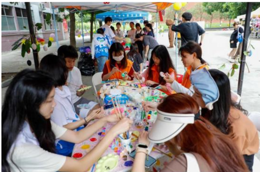
图 5 健康游园会