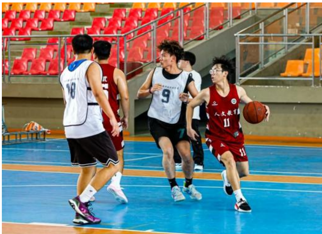
图 1 校园篮球联赛

2023年3-6月，以社团文化节为载体，着力打造标杆社团，规范社团管理，以“一社一活动”目标，10-12月，以大规模纳新活动为契机，开展体育文化节、迎新晚会、社团之夜、新年晚会等品牌活动，为学生提供展示文艺风采、凸显个性魅力的大舞台，也是学校以文化人、以美育人的重要抓手。下一步，学校将推出更多师生喜闻乐见、内涵丰富的文化艺术活动，着力提升校园文化品质，打造校园文化品牌，以校园文化建设为学校高质量发展凝聚特色、增添亮点。