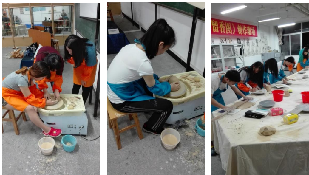
图 2 《陶瓷设计与制作》课堂