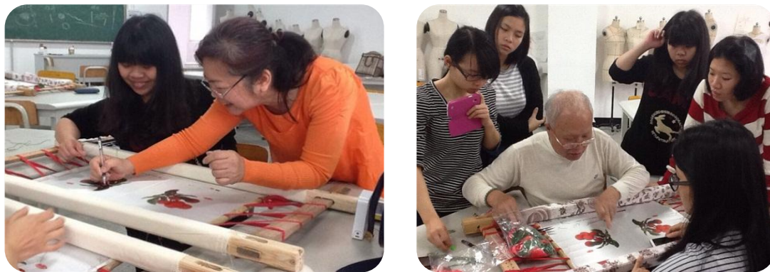
图 1 广绣大师用心指导学生《广绣技法》

编织》《传统编织装饰壁挂》《皮具小饰品制作》《潮流艺术创作》《公共艺术实践与鉴赏》等 20 门公共美育选修课程，希望大学生自由选择自己喜欢的艺术类课程，在当今社会文化语境中，自觉经营情感发达、境界高远、富有意义的美丽人生，拥有一个真正健康向上的“美丽大学”。此外，我校每学期还结合课程的教学，集中举行学生习作展，让全校学生欣赏艺术作品之美、地方传统文化之美。