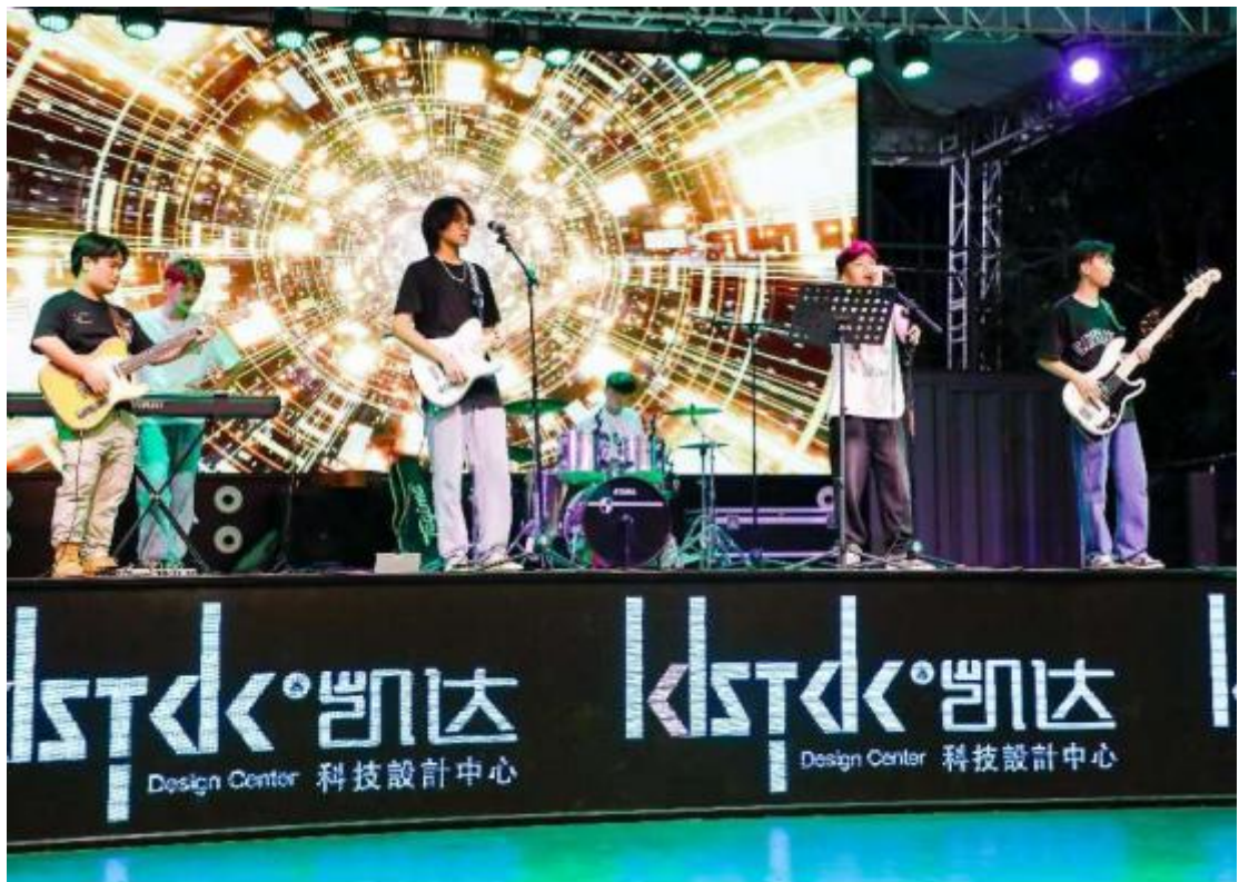
图 9 校外社团活动基地音乐会